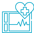
深切治疗 (重症加护治疗)