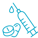
其他住院杂项开支， 例如化验室费用、 药物和注射