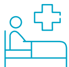
每天病房和膳食开支