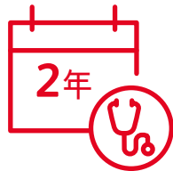
每2年可享身體檢查