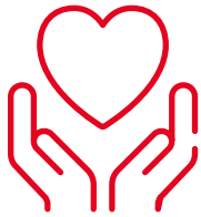
人壽及長期護理保障 兩者兼備