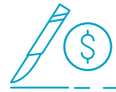
住院和门诊 外科手术费用