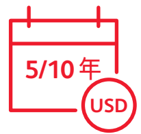
设有5年或10年缴费年期 保单以美元结算