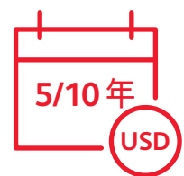
設有5年或10年供款年期 保單以美元結算