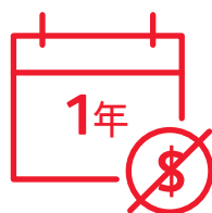
如失業或確診癌症 可享長達1年延繳保費保障