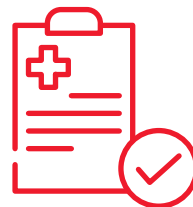
完成簡單健康申報 即可投保