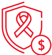
不幸患癌可獲 一筆過額外保障